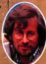
監 督 スティーブンスピルバーグ