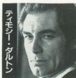
ティモシー・ダルトン

主演のジェームズ・ボンドには、本作が2度目のボンド役となるイギリスの名優ティモシー・ダルトン。前作「リビング・デイズ」以前のキャリアは実に凄く、ピーター・オートール、キャサリン・ヘップバーンとの共演による「冬のライオン」。サー・アレック・ギネス、リチャード・ハリスとの「クロムウェル」、ヴァネッサ・レッドグレイブ、グレンダ・ジャクソンとの「クイン・メリー」愛と悲しみの生涯」、アンナ・カルダー・マーシャルとの「嵐が丘」等々がある。しっかりした演技力の裏付けは、今作の友情の為に栄光の007ライセンスを捨てる男の哀しみを見事に演じ切っている。