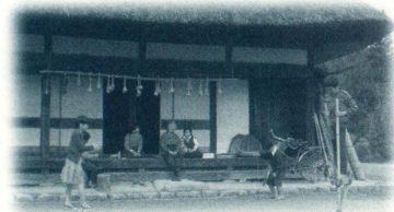
日本初 Film Stream Camera [VIPER] によるHD非圧縮フルデジタルシネマとして完成