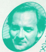
シ ヘ リ ー (父)