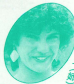
シ ヘ リ ー (母)