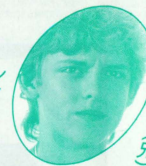
ケ ニ ー (ケニー)