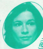
シ ヘ リ ー (母)