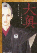
原作コミック1巻～5巻 絶賛発売中! ©よしながふみ/白泉社

美しき男の園となつた大奥に渦巻く、 野望、悲哀、嫉妬、策略、そして愛。 斬新な設定が生み出す濃密なド ラマが高く評価され、2009年 度手塚治虫文化賞を受賞した、 よしながふみの人気コミックを原 作に、2010年10月1日、誰も 観たことのない大奥の扉が開く!