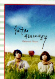
天国への郵便配達人 Postman to heaven

さまざまな愛の形を描き、韓国で大きな話題を呼んだ「Telecinema 7 プロジェクト」7作品をスクリーンで上映！