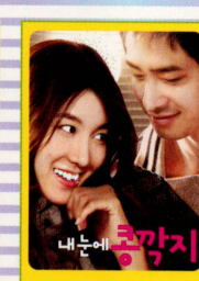
顔と心と恋の関係 Relation of Face, Mind and Love