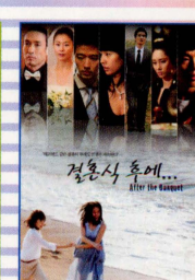
結婚式の後で After the Banquet