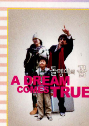
石ころの夢 A dream Comes True