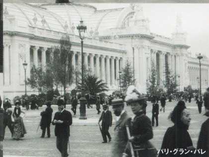
パリ・グラン・パレ