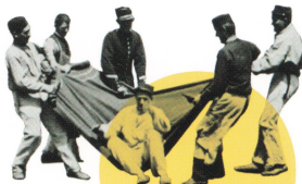
毛布による肩上げ