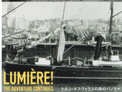
トルコ・ボスヴォラスの岸のパノラマ