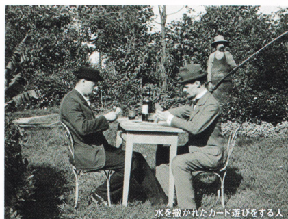
水を撒かれたカード遊びをする人