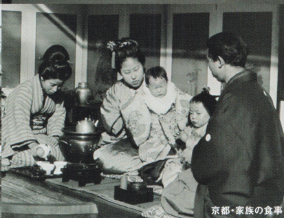
京都・家族の食事