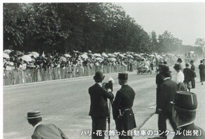
パリ・花で飾った自動車のコンクール(出発)