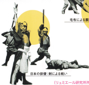
日本の俳優：剣による戦い